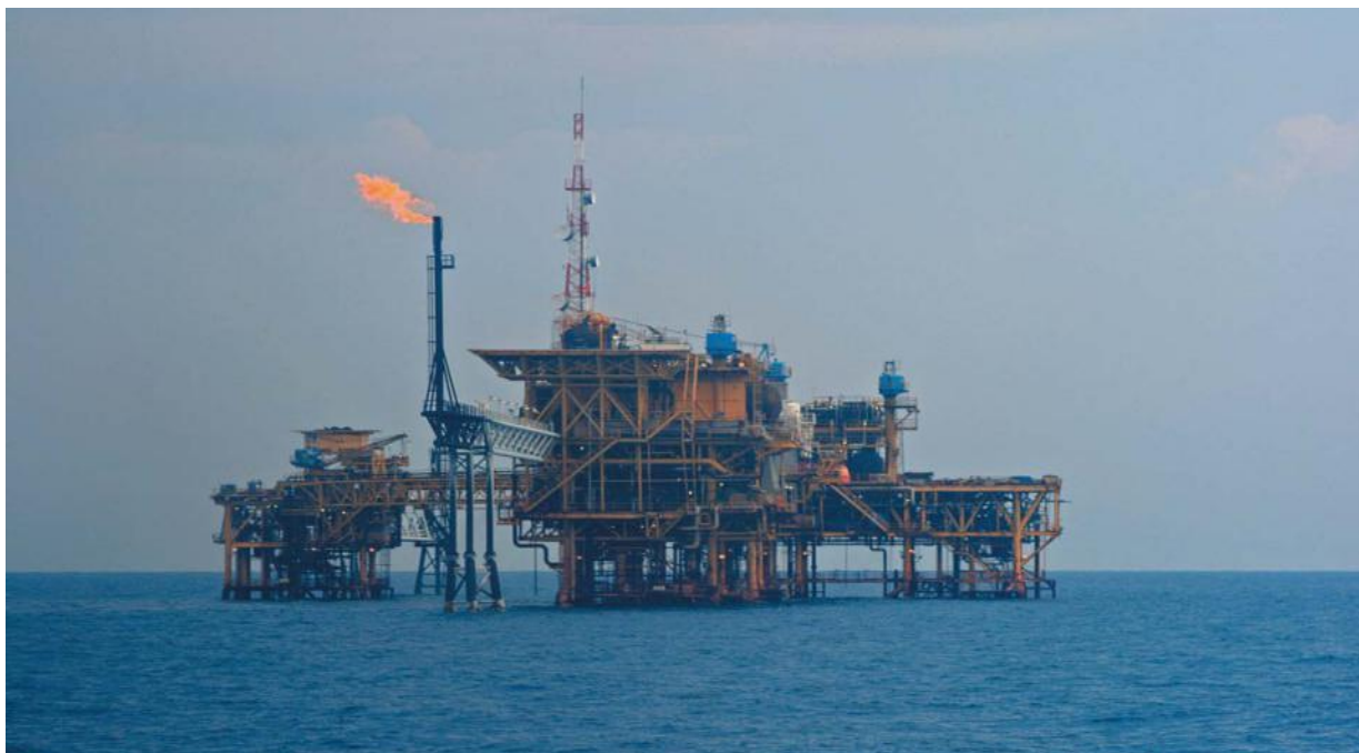
中海油在印尼的作业平台