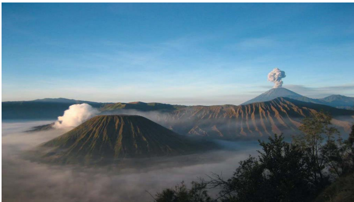
印尼著名的活火山—BROMO火山

印度尼西亚（以下简称印尼）位于亚洲东南部，由太平洋和印度洋之间的17508个大小岛屿组成，是世界上最大的岛国、最大的群岛国家，国土面积191.4万平方公里，海洋面积316.6万平方公里（不包括专属经济区）。包括苏门答腊岛、爪哇岛、苏拉威西岛以及婆罗洲和新几内亚的部分地区。与巴布亚新几内亚、东帝汶、马来西亚接壤，与泰国、新加坡、菲律宾、澳大利亚等国隔海相望。