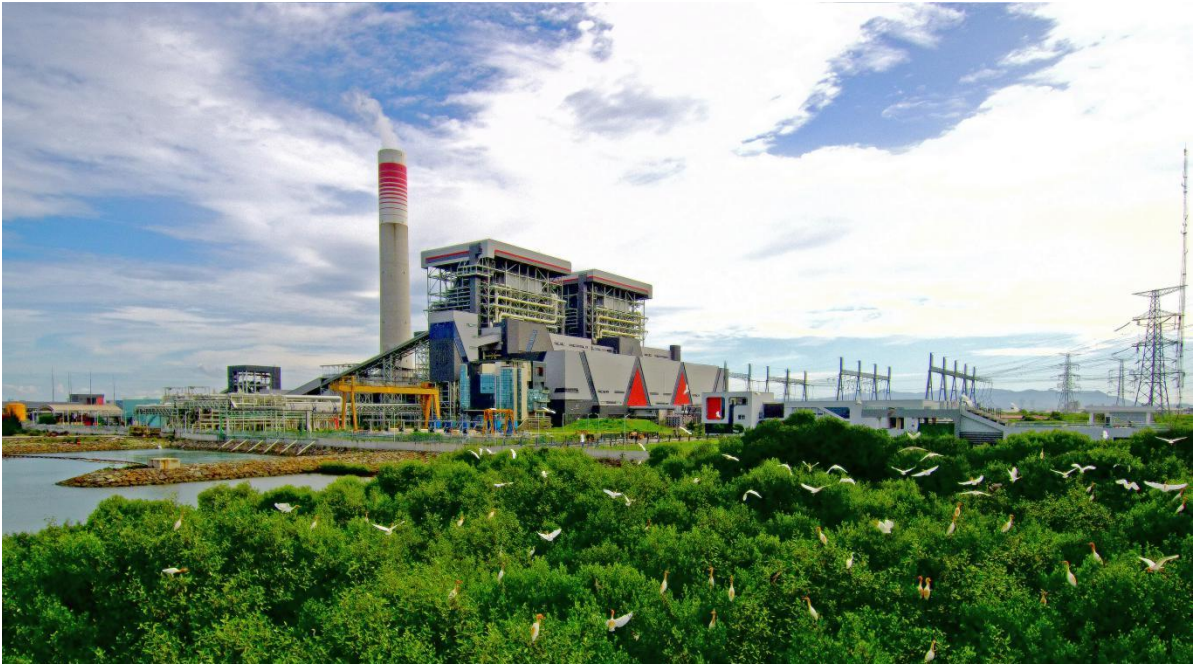
国华印尼爪哇7号项目