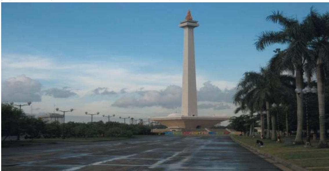
印尼独立纪念碑广场