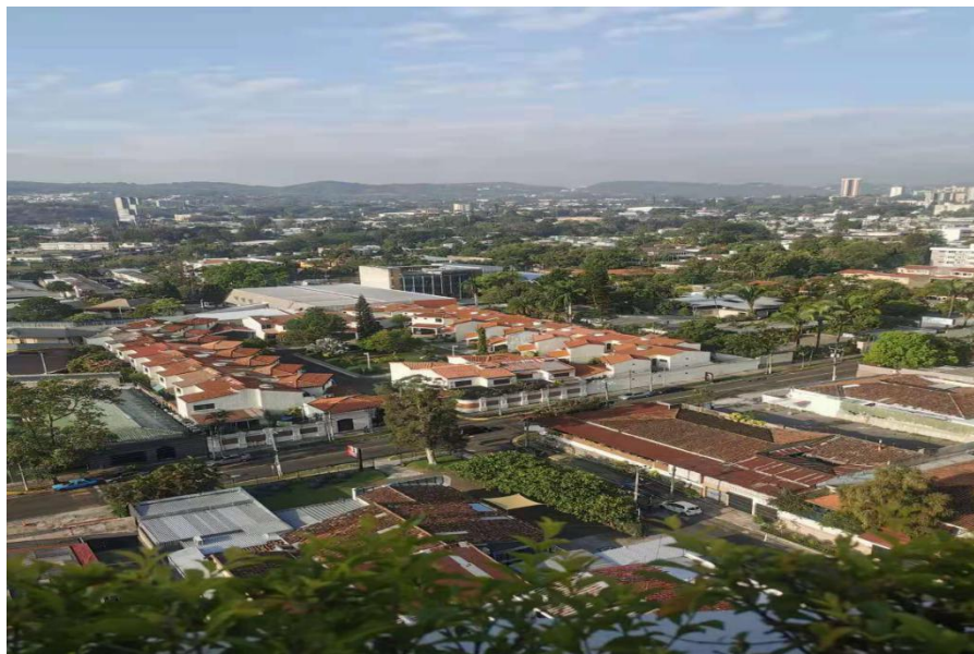
首都 圣萨尔瓦多市