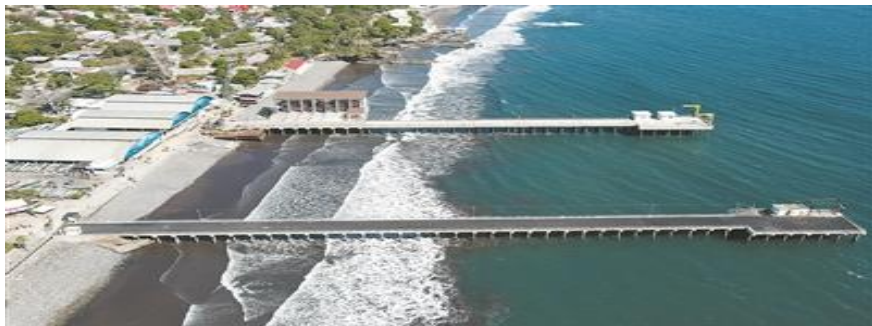
中国港湾公司援建的拉利伯塔德码头