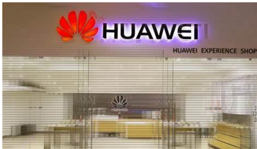
华为萨尔瓦多分公司

目前，在萨尔瓦多投资的中资企业主要有华为萨尔瓦多分公司、中国港湾驻萨尔瓦多分公司、中国建筑萨尔瓦多分公司、河北建工集团萨尔瓦多分公司等。