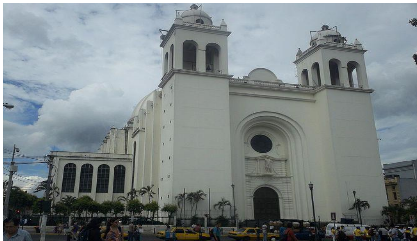
圣萨尔瓦多大教堂

萨尔瓦多是中美洲面积最小、人口密度最高的国家。目前，该国正处于人口结构转型阶段，人口增长放缓，青年人口数量下降，人口逐渐老龄化。萨央行2024年人口统计显示，萨育龄妇女（19岁至49岁）约为166万人，明显高于2007年。在被统计的190万个家庭中，8.3%的家庭至少有一个成员移民国外，高于2007年的7.9%。萨尔瓦多中央储备银行2024年人口普查数据显示，美国是萨移民主要目的国，86%的萨侨民在美居住。除美国之外，萨侨民比较集中的国家依次是西班牙（4.5%）、意大利（1.9%）和墨西哥（1.6%）。