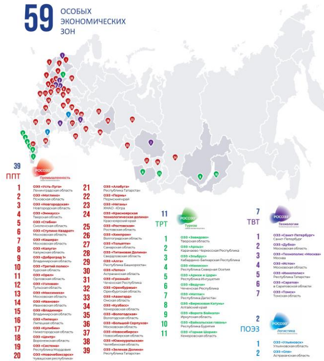
图5-1 俄罗斯经济特区分布