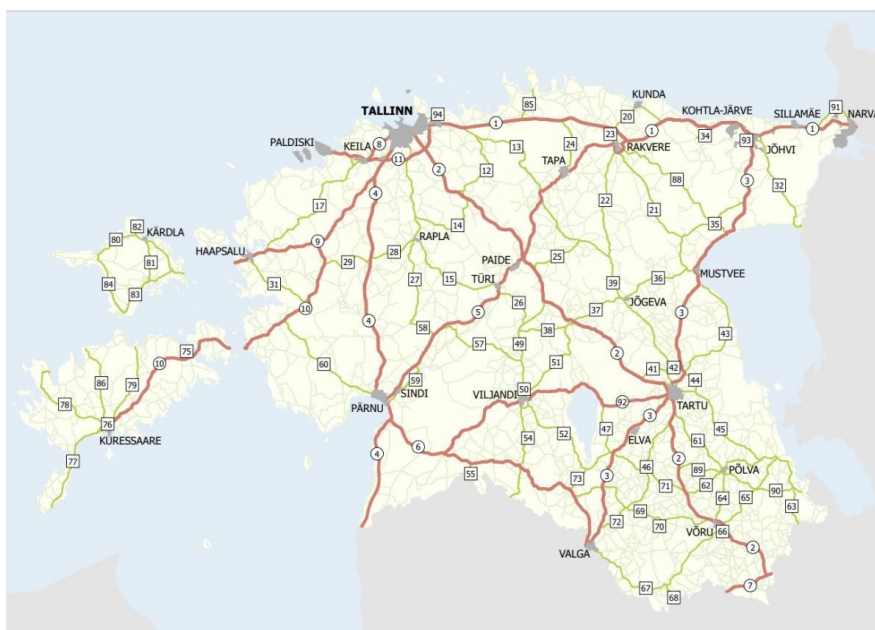
爱沙尼亚公路走向示意图

截至2025年1月1日，爱沙尼亚国道长度为16994公里。在全国公路中，高速公路里程为947公里（占5.6%），十吨级公路为1289公里（占7.6%），主要道路为1603公里（占9.4%），基础道路为2407公里（占14.2%）。截至2023年1月1日，爱沙尼亚国道上共有1161座桥梁和高架桥。爱沙尼亚公路网络的三条主干线分别为：塔林—纳尔瓦公路，塔林—塔尔图公路，塔林—帕尔努公路，分别与拉脱维亚和俄罗斯相连。公路运输是爱沙尼亚最主要的运输方式，2024年公路客运量达1.8亿人次，公路货运量约2983万吨。