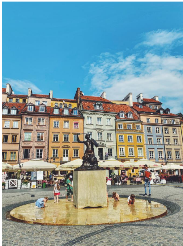
华沙老城集市广场的美人鱼雕像