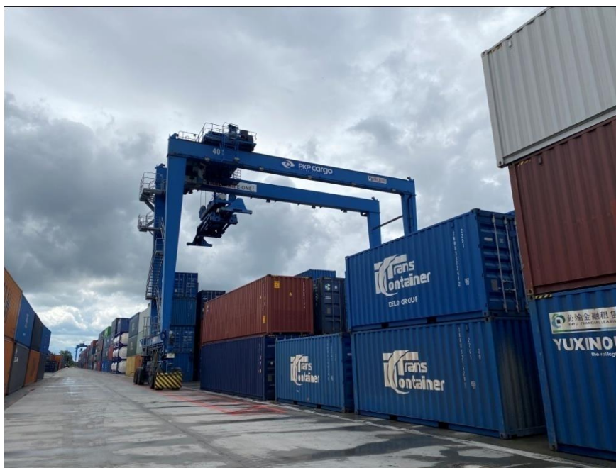
中欧班列进入欧盟的重要换轨节点波兰马拉舍维奇场站