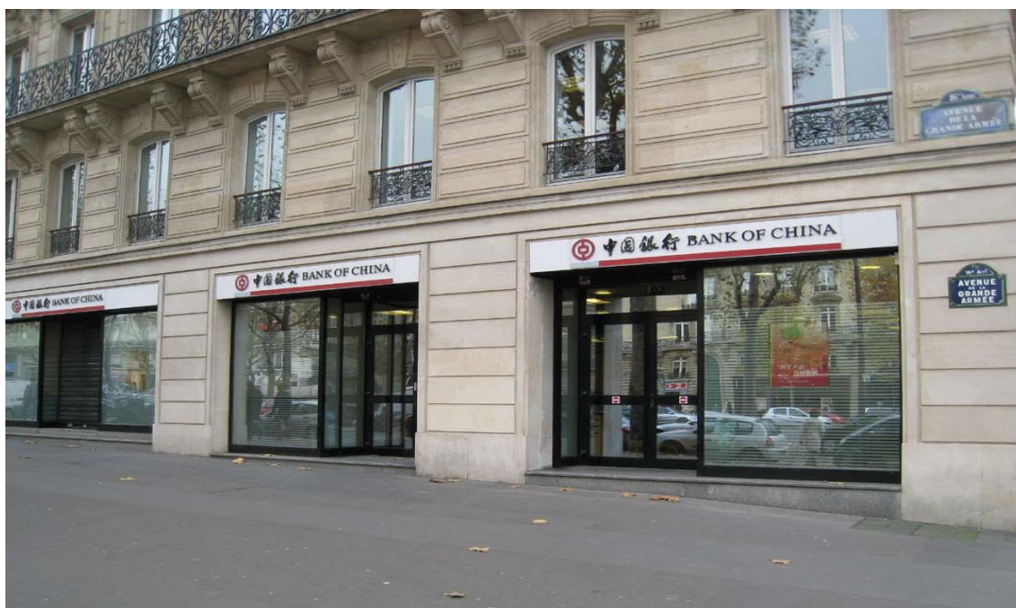
中国银行巴黎分行

【外资银行】 主要外资银行有：汇丰银行（HSBC）、巴克莱银行（Barclays）、德意志银行（Deutsche Bank）、苏格兰皇家银行（RBS）、瑞银集团（UBS）。