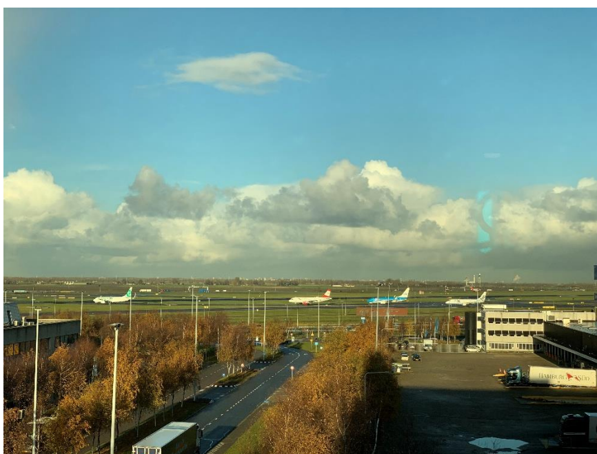
阿姆斯特丹史基浦机场

阿姆斯特丹史基浦国际机场多年来一直是欧洲四大航空枢纽之一，已经与近100个国家（地区）的327个机场间建立了直航。鹿特丹、埃因霍温、马斯特里赫特、莱利斯塔等城市有4个中央政府管理的机场，主要停靠往返于欧洲地区国家的廉价航班；登海尔德和埃因霍温有两个军民两用机场；此外，还有12个省级政府管辖的小型民用机场。