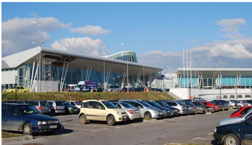
保加利亚首都索非亚市机场