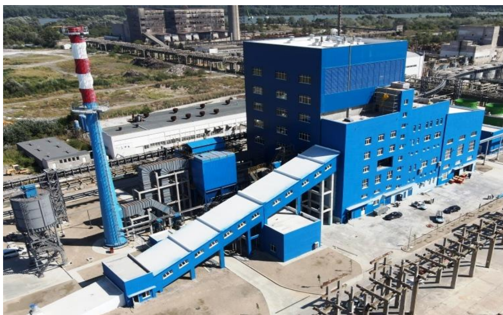
济南锅炉承建的保加利亚斯维洛萨（SVELOSA）公司生物质废弃物发电厂项目

据中国商务部统计，2024年中国企业在保加利亚新签承包工程合同13份，新签合同额1.66亿美元，完成营业额8314万美元。累计派出各类劳务人员9人，期末在保加利亚劳务人员14人。