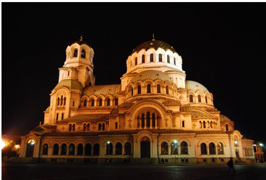
首都标志性建筑——涅夫斯基教堂

截至2024年底，保加利亚用于医院救助的医疗机构数量为341个，床位为56061张；其中医院319个，拥有病床53806张。平均每10万人拥有医院床位870.9张。此外，还拥有门诊卫生机构2289个，拥有床位1283张，其他卫生机构149个，其他卫生机构拥有的床位为1849张。