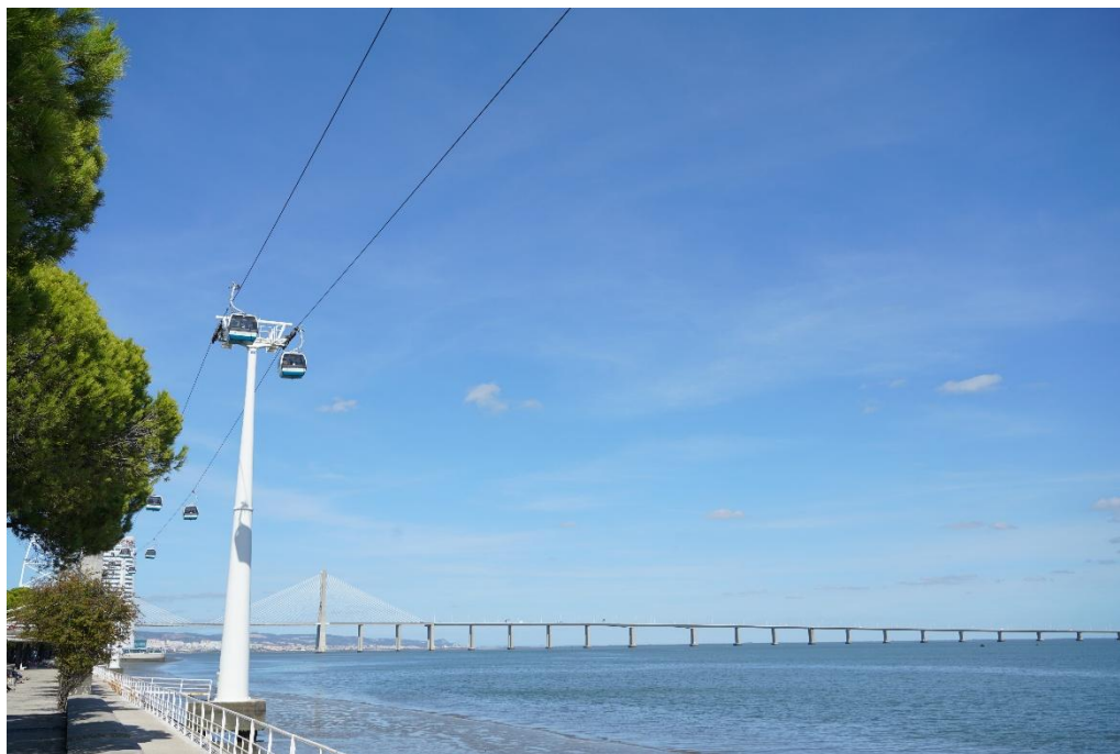
里斯本达伽马大桥

首都里斯本位于北纬38°42'、西经9°5'，南临伊比利亚半岛的特茹河入海口，西濒大西洋，是葡萄牙的政治、经济、金融、文化和科技中心，是欧洲大陆最西端的大城市，南欧著名的世界都市之一，葡萄牙主要的港口城市之一，亦为葡萄牙高等教育机构最集中的地方。里斯本是欧洲著名的旅游城市，西部大西洋沿岸有美丽的海滨浴场，2024年里斯本被世界旅游大奖（WTA）评选为“全球最佳度假城市”，在第四届世界邮轮大奖颁奖典礼上，里斯本港邮轮码头第二次被评为欧洲最佳邮轮码头。里斯本是工业发达的城市，主要工业有造船、水泥、钢铁、塑料、软木、纺织、造纸和食品加工等。特茹河南岸是葡萄牙的重要工业中心。