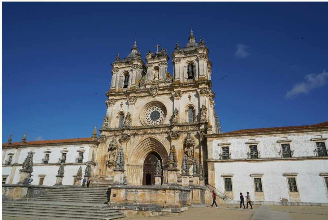
阿尔克巴萨修道院

【罢工】根据葡萄牙就业与劳动局公布的数据,2024年葡萄牙罢工活动共计1099次,同比下降26.49%。其中360次来自企业,739次来自非企业部门。在葡萄牙的中资企业未发生罢工情况。