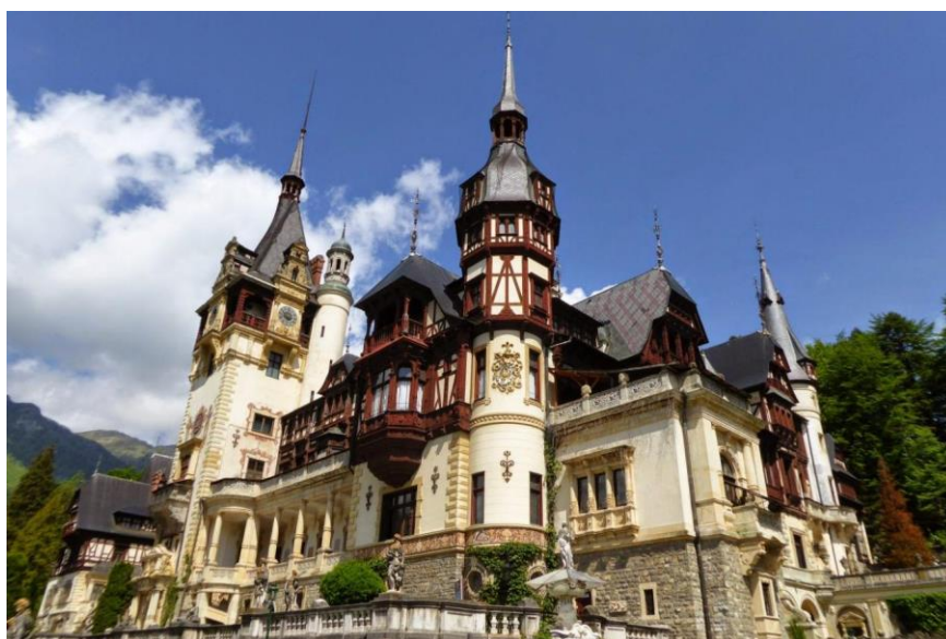
罗马尼亚佩列什王宫

罗马尼亚户籍常住人口为约1906万人（2024年数据）。其中，罗马尼亚族占88.6%，匈牙利族占6.5%，罗姆族（即吉卜赛人）占3.2%，日耳曼族和乌克兰族各占0.2%，其余民族为俄罗斯、土耳其、鞑靼等。