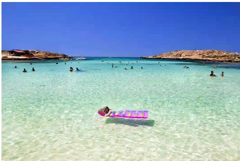
塞浦路斯海滩

最佳目的地之列，在年度蓝旗榜单中位列全球第12位。2025年6月，欧盟称包括塞浦路斯在内的5个欧盟国家（保加利亚、希腊、奥地利、克罗地亚、塞浦路斯）95%以上的浴场水质“极好”，塞浦路斯以2024年浴场99.2%的优质率连续3年位列欧盟第一。“阳光、沙滩、海水”成为塞浦路斯吸引游客的三大名片。塞浦路斯是典型的地中海式气候，夏季长达半年，干燥炎热，适宜水上运动，是旅游旺季。冬季短暂，温润多雨，山顶有滑雪场，可以一天之内上山滑雪、下海游泳。根据欧盟统计局数据，新冠疫情前，塞浦路斯旅游业对GDP贡献率约15%，提供了约5万个就业岗位，占非金融类就业岗位的20%。2020年，受疫情冲击，全年访塞游客骤降八成以上，旅游业损失惨重。2023年，塞浦路斯旅游业已恢复到疫情前2019年的水平，全年入境外国游客高达384万人次，同比增长20.1%，全年旅游业收入30亿欧元，同比增长22.6%。2024年，塞浦路斯旅游业有了新的发展，全年入境外国游客首次突破400万人次，打破了2019年纪录，全年旅游业收入32亿欧元，同比增长6.3%。