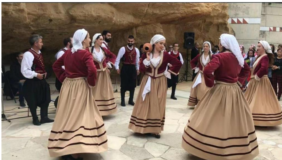
塞浦路斯传统舞蹈

塞浦路斯人十分注重休闲放松时间。政府部门、公司、银行等周末和公共假日都不上班。除一些旅游区商店和大型商超外，超市、商店等周日歇业或缩短营业时间。夏季天气炎热，7至8月是休假季，很多人选择外出度假。