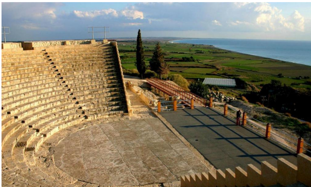
库伦剧场考古遗址