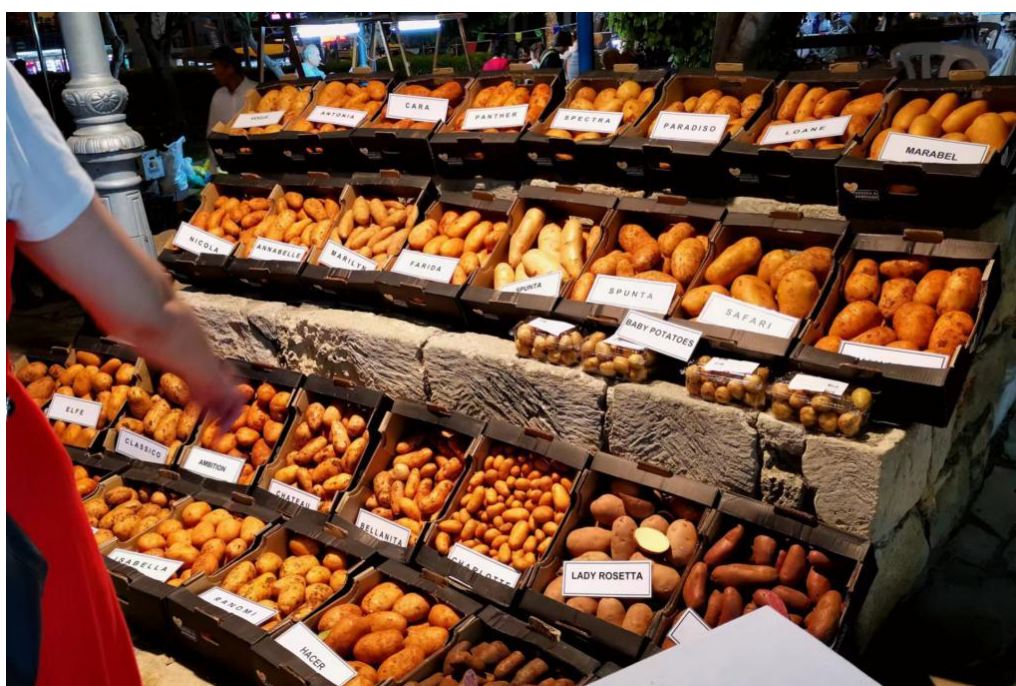
塞浦路斯盛产多种高品质土豆

塞浦路斯主要出口货物包括：①船舶及浮动结构体；②矿物燃料、矿物油及其产品、沥青等；③药品；④乳、蛋、蜂蜜、其他食用动物产品；⑤电机、电气、音像设备及其零附件。