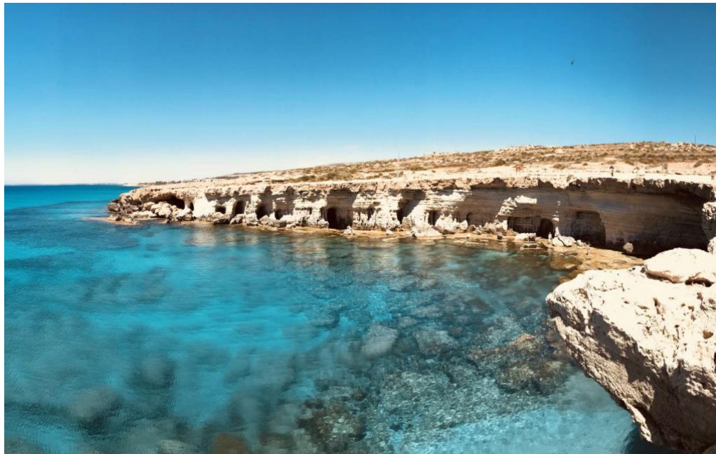
阿依纳帕（圣纳帕）海岩洞

塞浦路斯属东二时区，比北京时间晚6个小时。每年3月底至10月底实行夏时制，比北京时间晚5个小时。