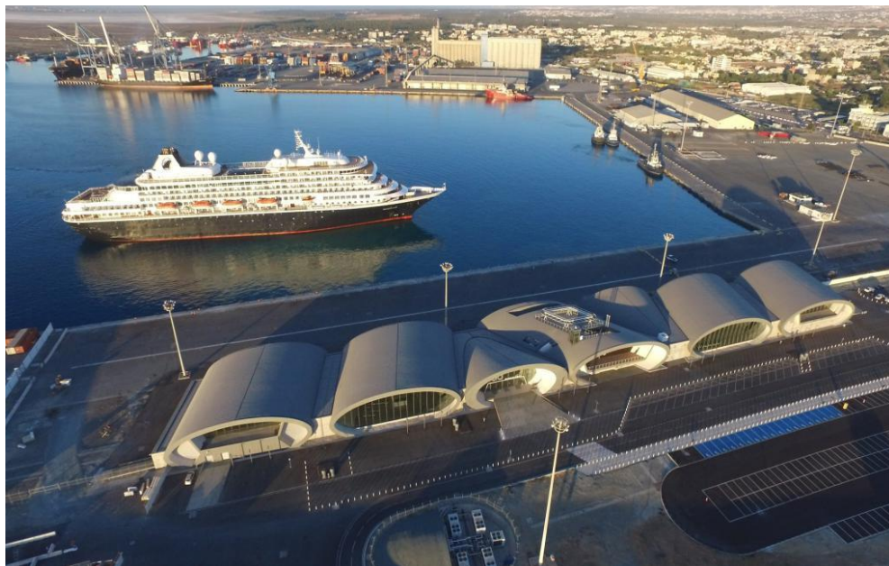
利马索尔游轮码头