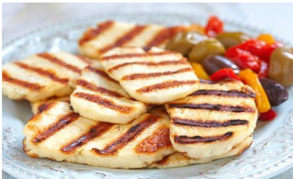
塞浦路斯特产哈鲁米奶酪

【制造业】 塞浦路斯制造业不发达，主要工业制成品有矿产品、简单机械、药品和加工农产品等。根据塞浦路斯统计局数据，2024年制造业实现产值14亿欧元，同比增长2.9%。塞浦路斯制药行业以生产仿制药为主，近年来发展迅速。目前，药品已成为塞第一大出口类别，出口至110个国家和地区，包括日本、澳大利亚和巴西等监管非常严格的国家。