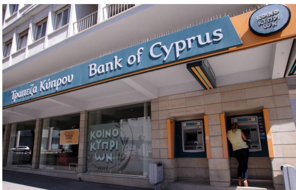
塞浦路斯银行营业网点之一

目前，中国工商银行希腊代表处（2019年获批）虽未直接在塞浦路斯设立分行，但依托希腊与塞浦路斯的地缘及经贸紧密性（同为希族、同属欧盟-欧元区），其服务已间接覆盖塞浦路斯市场，中国进出口银行中东欧基金亦明确将塞浦路斯纳入目标市场。此外，塞浦路斯作为欧元区成员国，跨境结算以欧元为主导，人民币使用依赖企业自主选择，暂无央行级清算行支持。