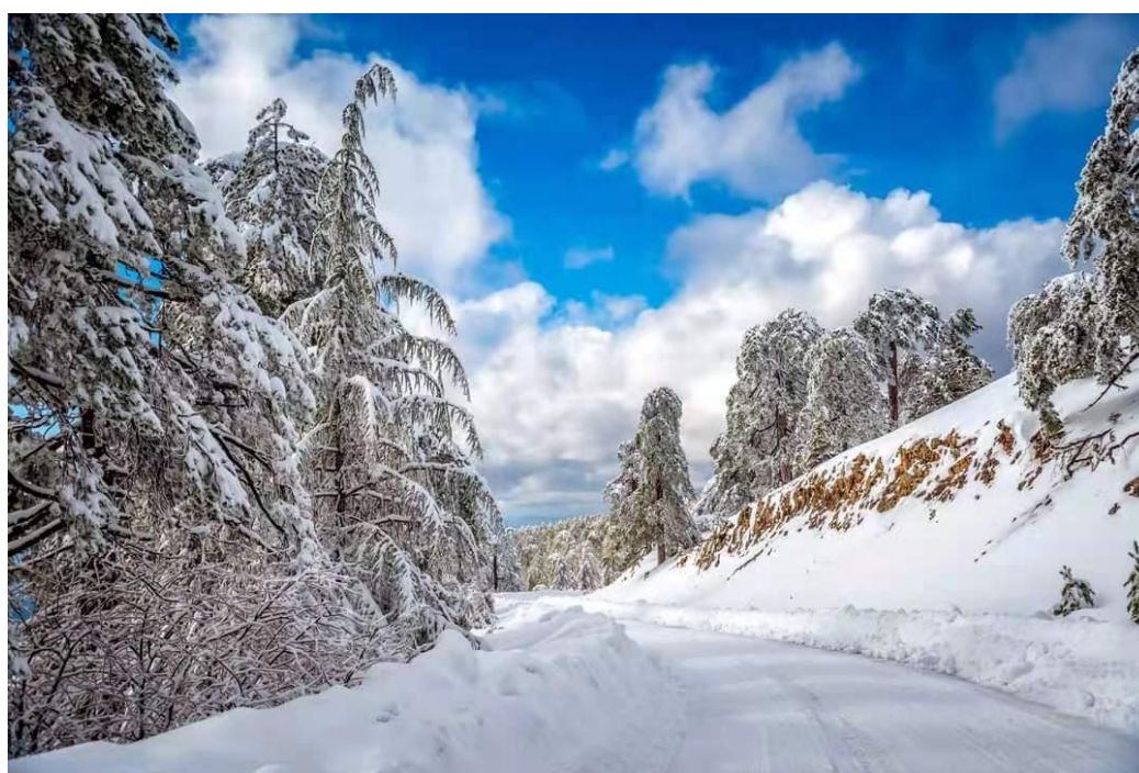
特鲁多斯山雪景

塞浦路斯属于亚热带地中海型气候，夏天干燥炎热，冬天温和湿润，春季和秋季较短。雨季通常在11月份至翌年3月份之间。冬季平均气温为18-20摄氏度，夏季平均气温为34-36摄氏度。年平均降雨量400毫米左右。