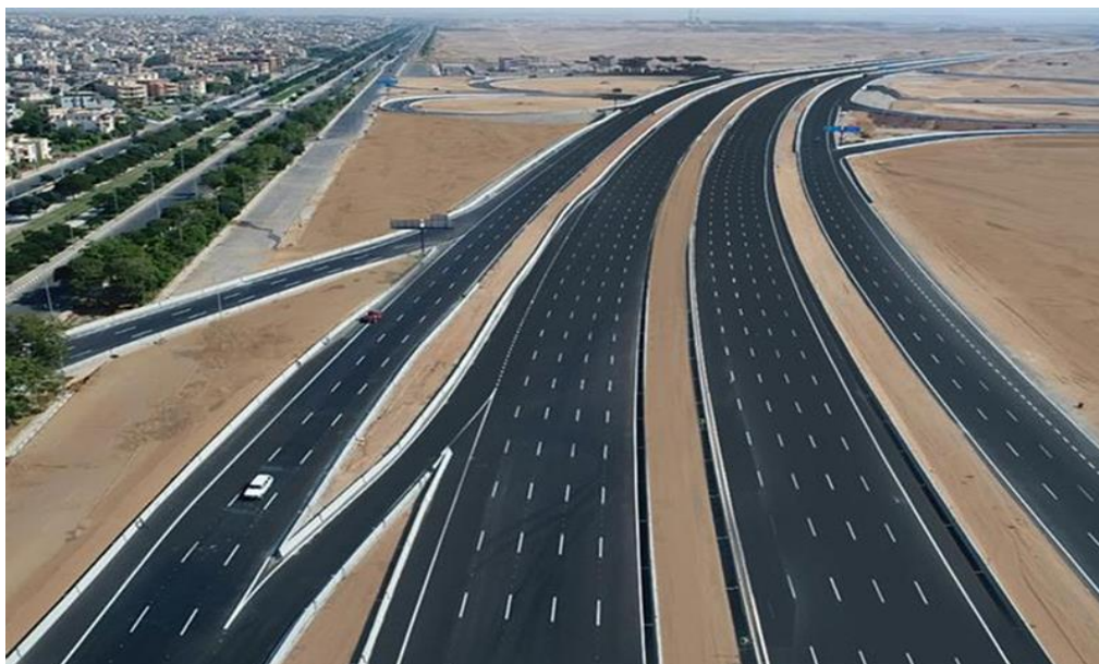
大开罗附近的中环路