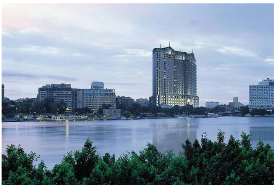
标志性建筑——开罗四季酒店