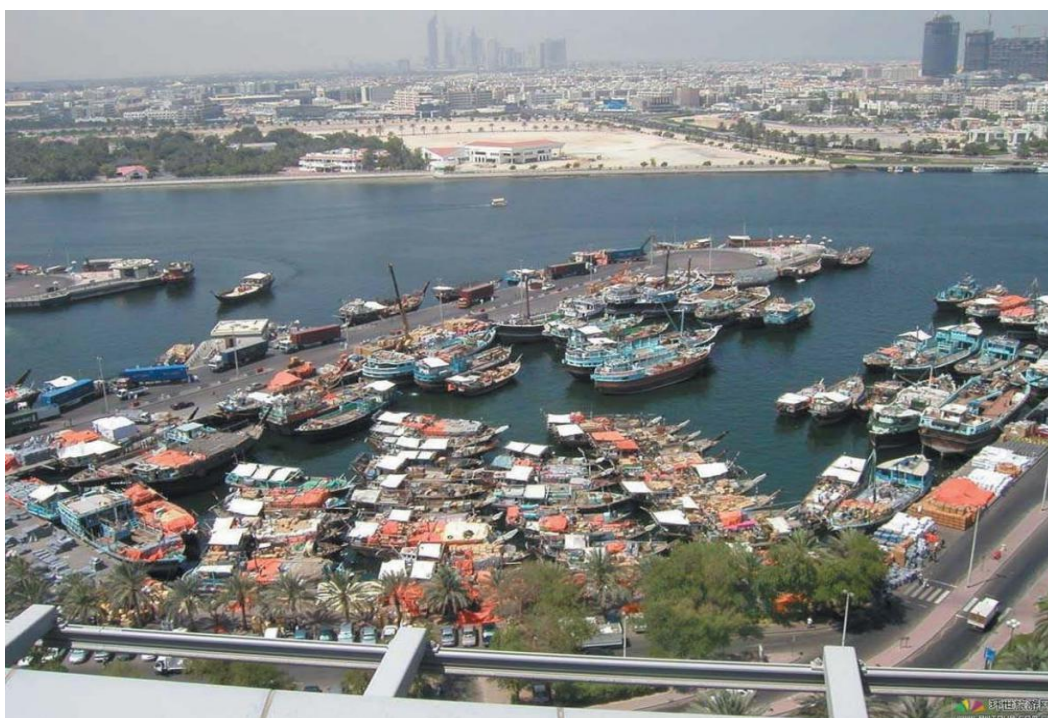
迪拜河（海水潮汐湾道）

阿联酋位于阿拉伯半岛东南端，东邻阿曼，西北接壤卡塔尔，南部和西南与沙特阿拉伯交界，北隔波斯湾（阿拉伯湾）与伊朗相望，扼守波斯湾进入印度洋的海上交通要冲。阿联酋国土面积约为8.36万平方公里（包括沿海岛屿，其中，阿布扎比酋长国面积占阿联酋总面积的87%），海岸线长约1318公里。