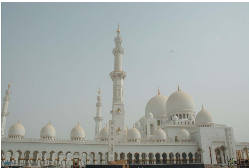
谢赫扎耶德清真寺

伊斯兰教是国教。居民大多信奉伊斯兰教，其中约80%属于逊尼派，什叶派则在迪拜等地占多数。