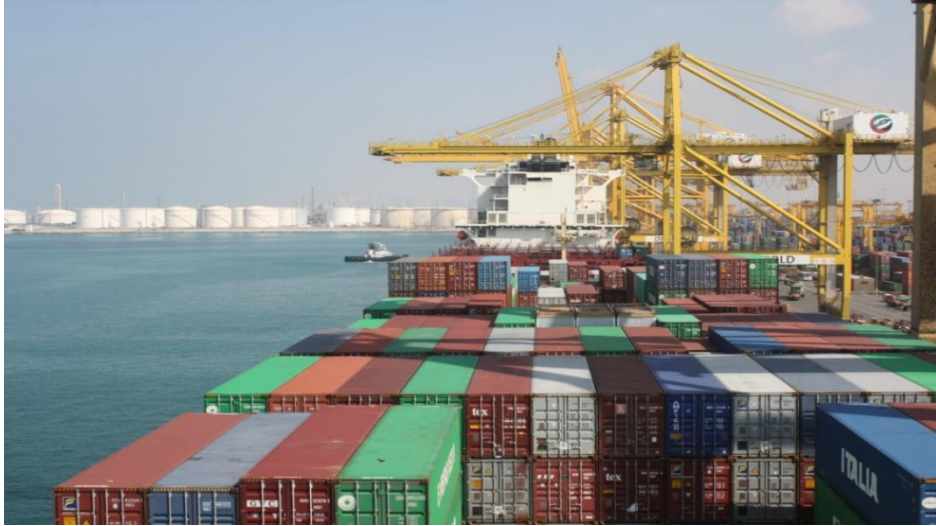
杰贝阿里集装箱码头

杰贝阿里港位于杰贝阿里自由区内，系世界最大的人工港，码头长15公里，有67个泊位，拥有世界一流的配套设施和服务。2024年处理了1550万个标准箱（TEU），同比增长7.4%，是中东北非地区第一大港，连续多年荣获中东最佳港口奖。