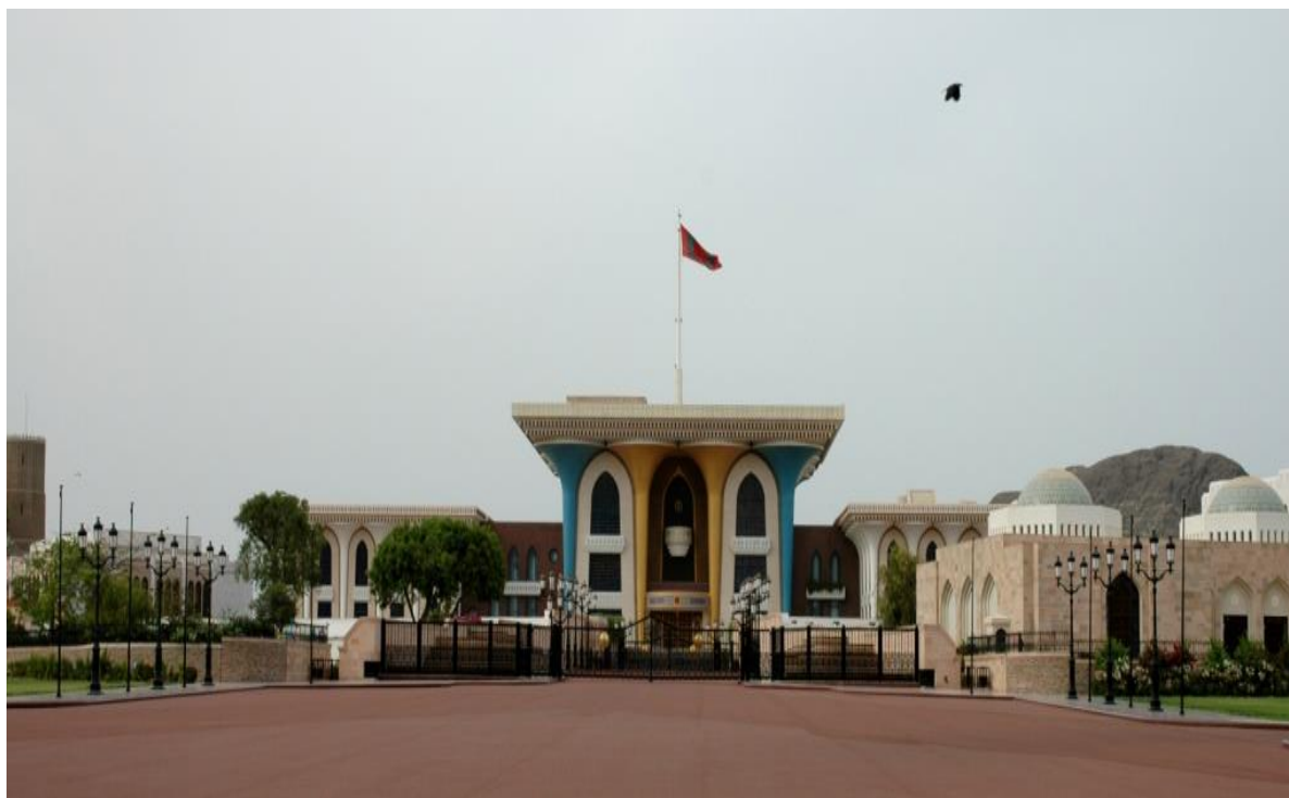
旗帜宫--苏丹重大礼仪活动地

【首都】 马斯喀特省由6个行政区组成，分别是马特拉、巴夫沙尔、希卜、阿姆拉特、马斯喀特和库拉亚特。其中，马斯喀特市既是阿曼的首都，也是该省的首府，位于阿曼东北部，地处波斯湾通向印度洋的要冲，三面环山，东南濒阿拉伯海，东北临阿曼湾，面积约为3900平方公里。马斯喀特市政规划有序，街道整齐，绿化美观，建筑富有民族特色。市内拥有距今400多年历史的著名的贾拉里古城堡等名胜古迹，还有皇家歌剧院、旗帜宫、卡布斯大学、卡布斯体育中心、卡布斯皇家医院、布斯坦宫饭店、马特拉集市等著名地标。马斯喀特已成为阿曼政治、经济、文化和商业中心。