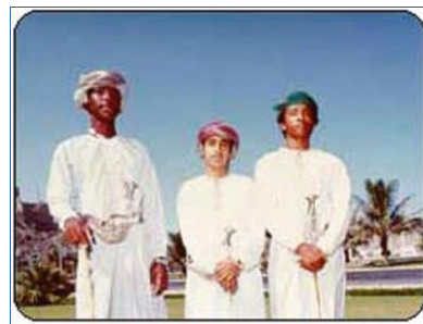
阿曼人的正式着装

【服饰】阿曼男子虽与大多数阿拉伯人一样穿无领长袖大袍、戴头巾，但有明显的不同：一是袍子的领口右侧垂有花穗，可以蘸注香水；二是头巾质地讲究，有很漂亮的花纹，扎缠在头，与沙特等国不同。在正式场合，男子一般习惯穿无领长袍，扎缠头巾，佩带弯刀，脚穿露出脚指的皮凉鞋。妇女喜饰金，服装艳丽。阿曼人能歌善舞，不过一般都是女歌男舞，男人在圈中欢快地跳舞，妇女则在外面以拍手唱歌伴舞。