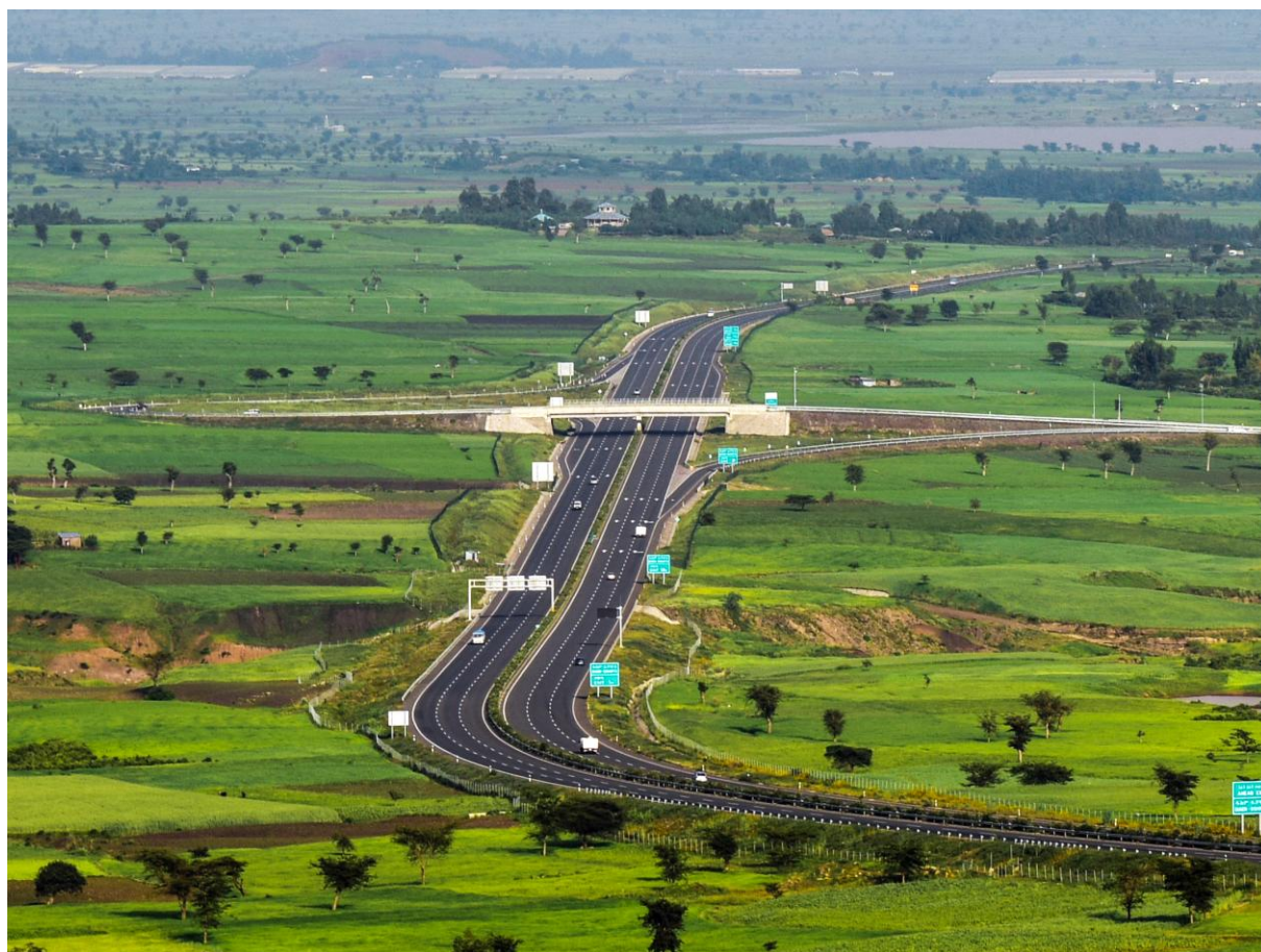
亚的斯亚贝巴至阿达玛高速公路（简称AA高速公路）