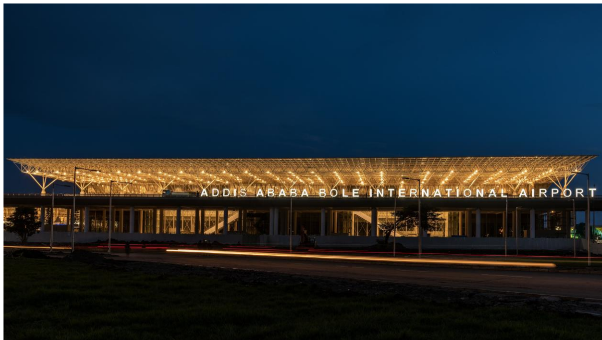
亚的斯亚贝巴博莱国际机场

个目的地提供35个货运航班。2025年6月27日，埃航正式开通从乌鲁木齐至亚的斯亚贝巴的直达货运航线。