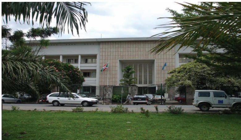
布隆迪共和国银行

【银行】布隆迪共和国银行为中央银行；商业银行包括布隆迪商业银行、布琼布拉信贷银行、布隆迪国家经济发展银行。除布隆迪共和国银行外，其他银行和金融机构及保险公司或多或少有外国或本国私人资本；私营股份制银行为英特银行、金融与管理银行。