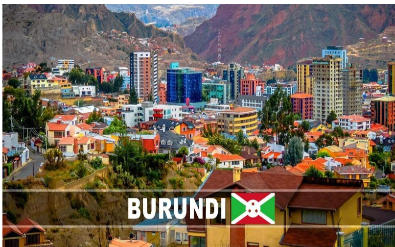
布隆迪布琼布拉市景

(3) 布鲁里市 (BURURI)。布隆迪西南部城镇，布鲁里省首府。东北距基特加66公里，有公路相通。