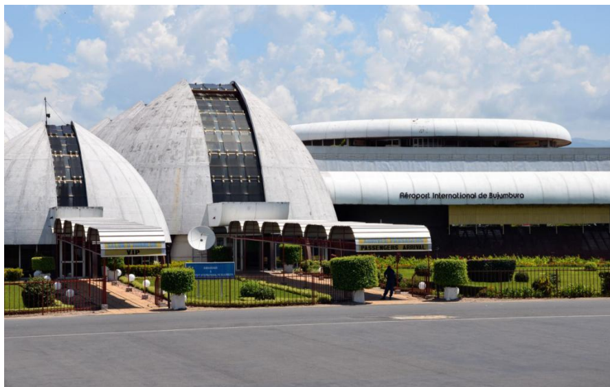
布隆迪布琼布拉国际机场

中国去往布琼布拉一般需经埃塞俄比亚首都亚的斯亚贝巴，或者肯尼亚首都内罗毕等地中转。