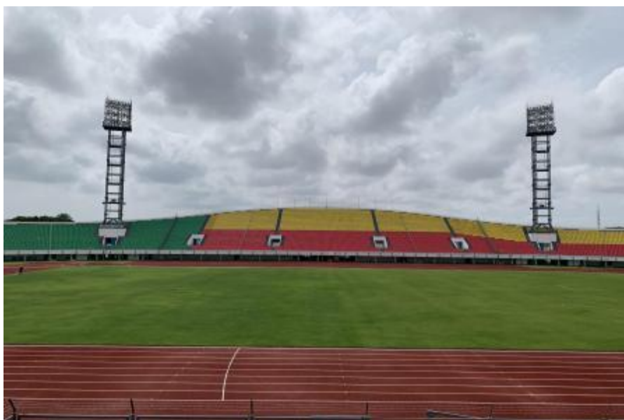
中国政府援建的贝宁马蒂尔·克雷库将军友谊体育场及维修项目

据中国商务部统计,2024年,中国企业对贝宁直接投资流量为-2716万美元;截至2024年底,中国企业对贝宁直接投资存量为1.46亿美元。中国企业在贝宁进行直接投资或开展境外加工贸易等活动起步较晚,但发展较快,涉及管道、纺织和农产品加工等行业。近年民营企业投资项目不断增加,包括木材加工、摩托车销售、矿泉水生产等项目。