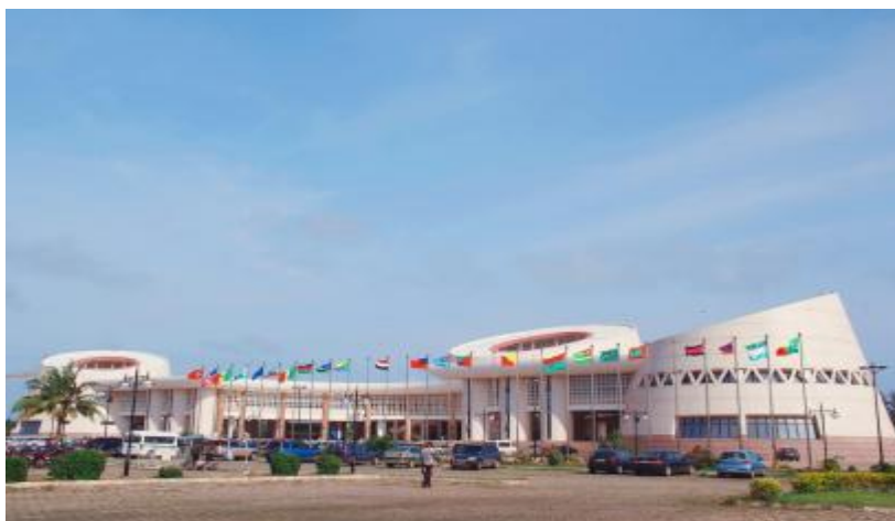
中国政府援建的贝宁科托努会议大厦

【议会】称国民议会，最高立法机构，实行一院制，行使立法权并监督政府工作，宪法规定，议员由直接普选产生，任期5年，可连选连任，但不得兼任其他公职。本届（第九届）议会于2023年1月8日选举产生，共有109名议员，其中复兴进步联盟53人、共和阵营28人，民主党28人。本届议会任期4年。议会领导机构依惯例为执行局，由议长、副议长、总务长、议会书记等7人组成。议会设法律和人权、财贸、生产和计划、教育文化和社会事务以及国防安全和对外合作关系等5个委员会。现任议长为进步联盟的路易·弗拉沃努（Louis Vlavanou）。