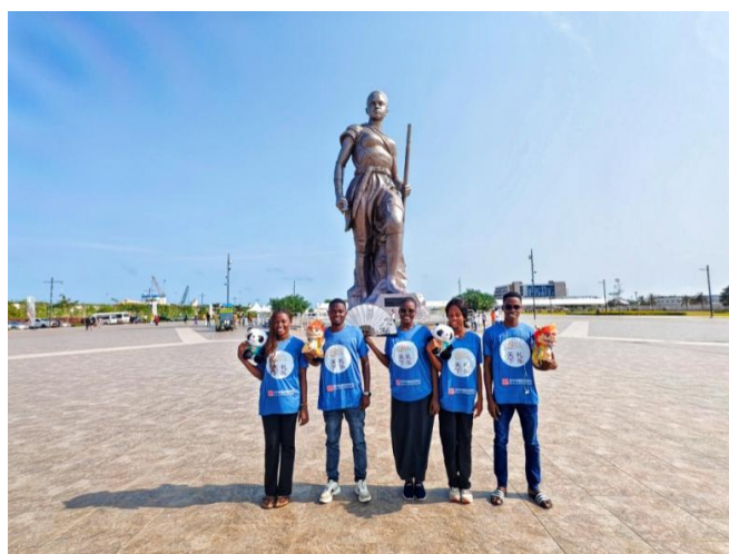
贝宁孔子学院学生在亚马逊广场合影