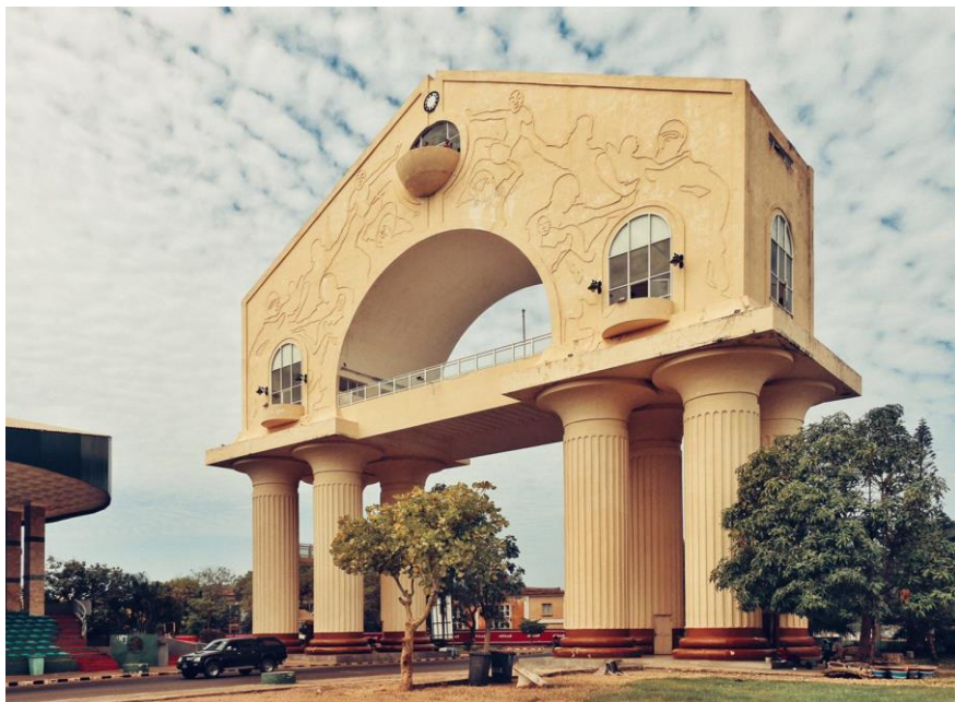
冈比亚地标建筑——班珠尔大拱门