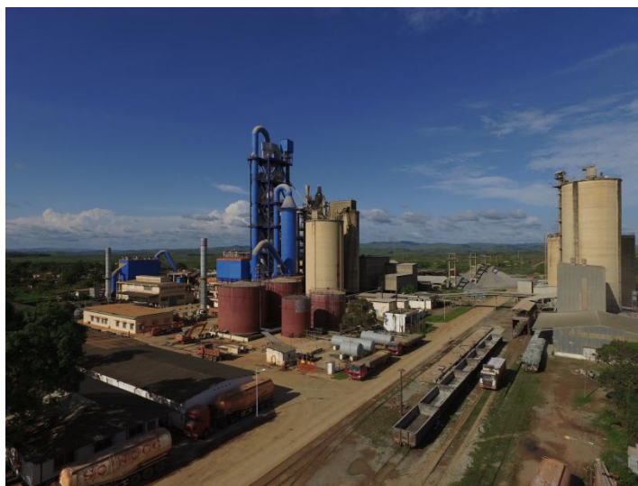
中国路桥与刚方合资建成年产30万吨刚果新水泥厂

【林业】刚果（布）拥有约2240万公顷的森林，约占刚果（布）国土面积的65.5%。刚果（布）以生物多样性和保护区网络密集闻名，保护区面积约占国土面积的13%。除天然林业资源外，刚果（布）还有7.3万公顷的人工培育林，主要是桉树（6万公顷），其他还有松树等多个品种。刚果（布）的木材品种有600余种，其中150种可用于加工，主要有奥库梅木、红木、桃花心木、黑檀木、铁木、达木、次果美木等。刚果（布）是仅次于巴西的世界第二大桉树产出国。全国森林资源约3亿立方米。从森林面积来看，刚果（布）是仅次于刚果民主共和国的非洲第二大森林国家。从开采量来看，目前居非洲第三位，主要出口欧洲及亚洲国家。林业是刚果（布）除石油外的第二大财政收入来源，也是除政府部门外第二大就业岗位提供者，林业经济占刚果（布）GDP的5-6%，在经济发展中起到重要作用。