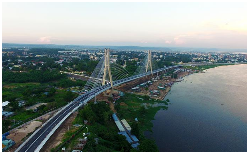
中国路桥承建的布拉柴沿河大道斜拉桥项目（“1960年8月15日”大桥）