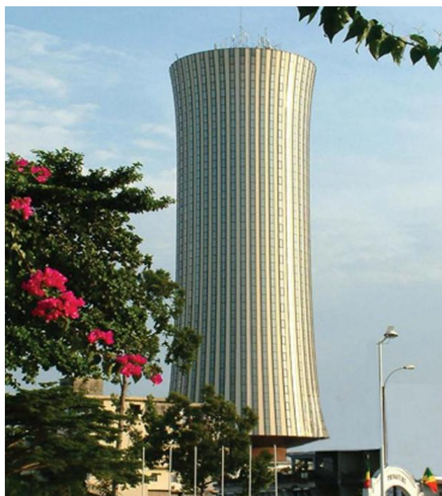
政府办公楼（当地称作“腰鼓楼”）

2021年4月，萨苏以88.4%的得票率在大选中胜出，再次连任总统，开启新一轮5年任期。5月，萨苏总统任命克阿纳托尔·科利内·马科索为总理，取消副总理一职，并根据总理提名，任命新一届政府。2025年1月，萨苏总统对政府进行小规模改组，新政府共有成员38人。总理为阿纳托尔·克利内·马科索（Anatole Collinet MAKOSSO），其余37人名单详见附录1。