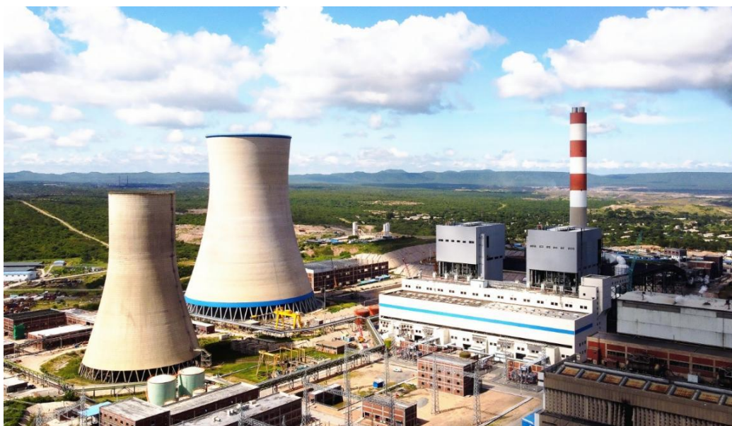
旺吉燃煤电站扩容项目（7-8号机组）