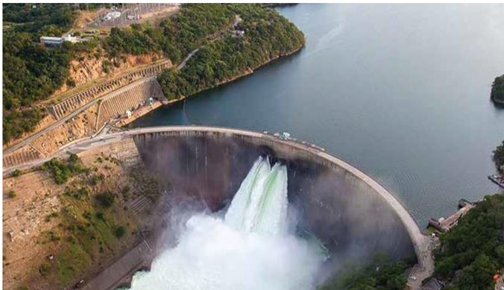
卡里巴南岸水电站