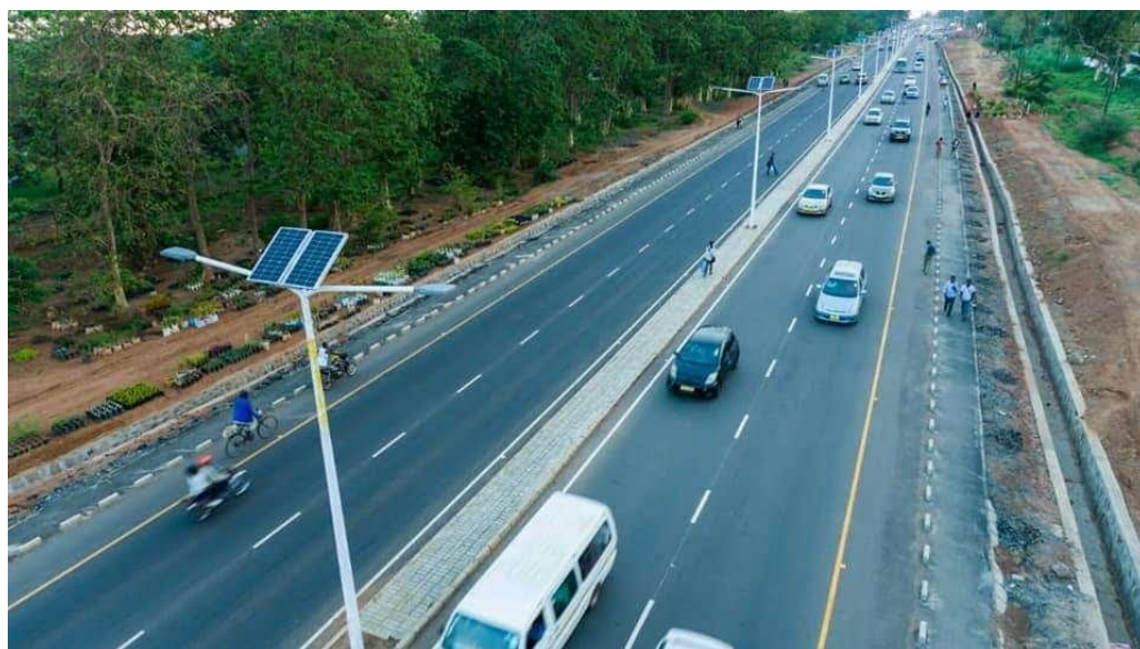
山东路桥承建的援马拉维首都机场M1公路

马拉维是内陆国家，交通运输以公路为主，公路承载了国内70%以上的货运和99%的客运，以及75%的国际货运。全国公路总长2.55万公里，其中沥青等铺装路4690公里（马财政部2024年度经济报告中的2022年数据）。马公路网与莫桑比克、坦桑尼亚、赞比亚、津巴布韦、博茨瓦纳及南非的公路连接。全国城际主干道少、等级低，无高速公路，多为双向两车道，从布兰太尔经利隆圭到姆祖祖，纵横南北的M1公路为马最重要的交通动脉。城市主干道和机场路高峰期拥堵，需改造提升。马拉维国家道路管理局数据显示，该国超过一半的道路需要重建或维护，比如，由欧洲投资银行（EIB）提供贷款，由中资企业和葡萄牙企业正在修建的301公里长的M1公路改扩建项目；由我国提供援款，由山东路桥承建并于2024年11月竣工的援马首都机场M1公路升级改造项