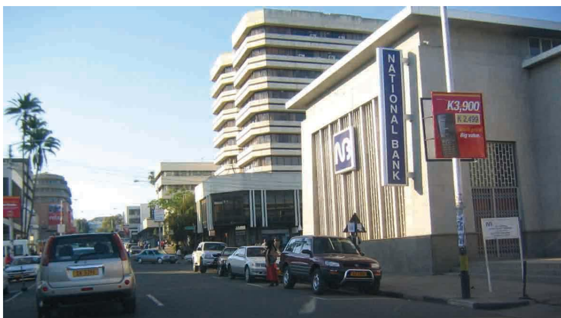
马拉维布兰太尔市商业街

马拉维经济不发达，物资匮乏，近年通胀严重，居民实际生活成本较高。据主要超市数据，目前，每公斤玉米粉、面粉、大米价格分别约1.2美元、4.1美元、3.0美元；每公斤牛肉、羊肉价格分别约13.7美元、10.8美元；每公斤土豆和西红柿价格约1.9美元；每公升牛奶、食用豆油价格分别约2.1美元、4.7美元；每10个鸡蛋约3.3美元。