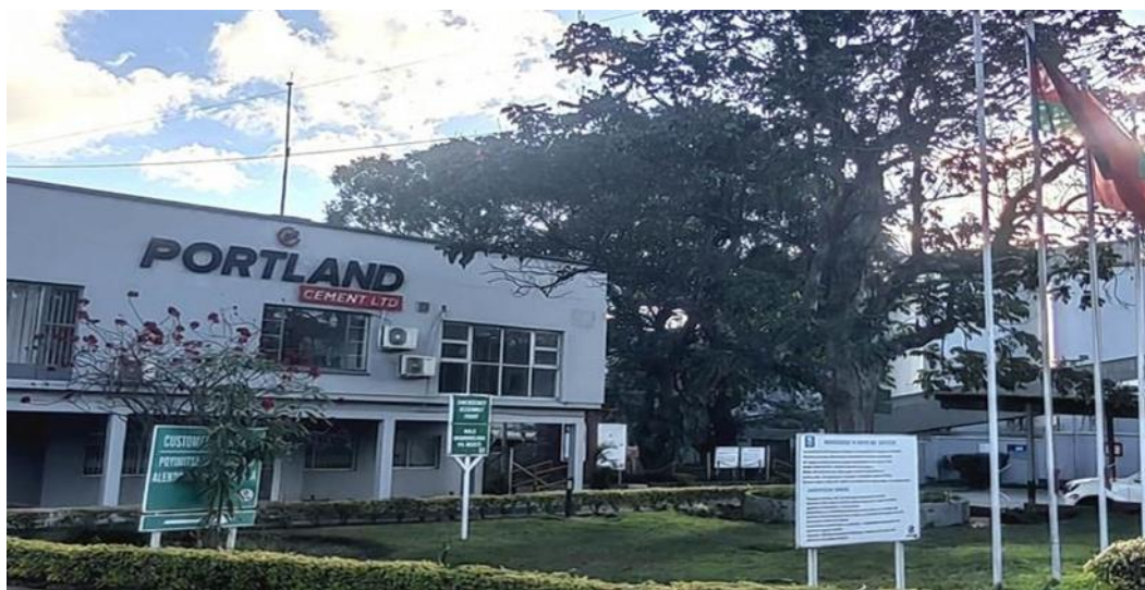
华新水泥投资的马拉维波特兰水泥公司

查，支付律师的费用30-50万克瓦查。公司注册一般需要10个工作日。公司注册手续完成后，便可分别到贸工旅游部和税务局申请营业许可和税务登记号，以及到商业银行开立银行账户。