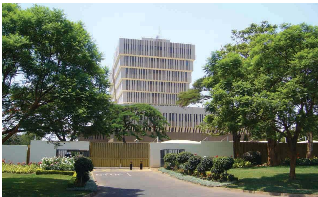
马拉维储备银行总部大楼

【中央银行】马拉维储备银行（RBM）是马拉维中央银行，负责制定货币政策和银行业务监管。