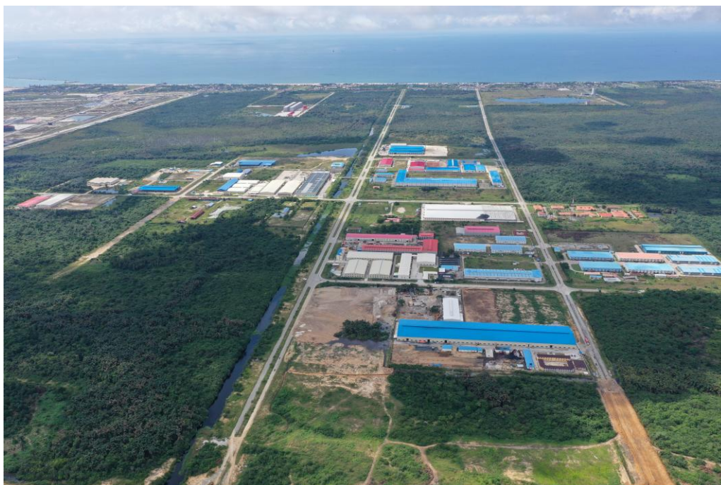
莱基自贸区航拍图