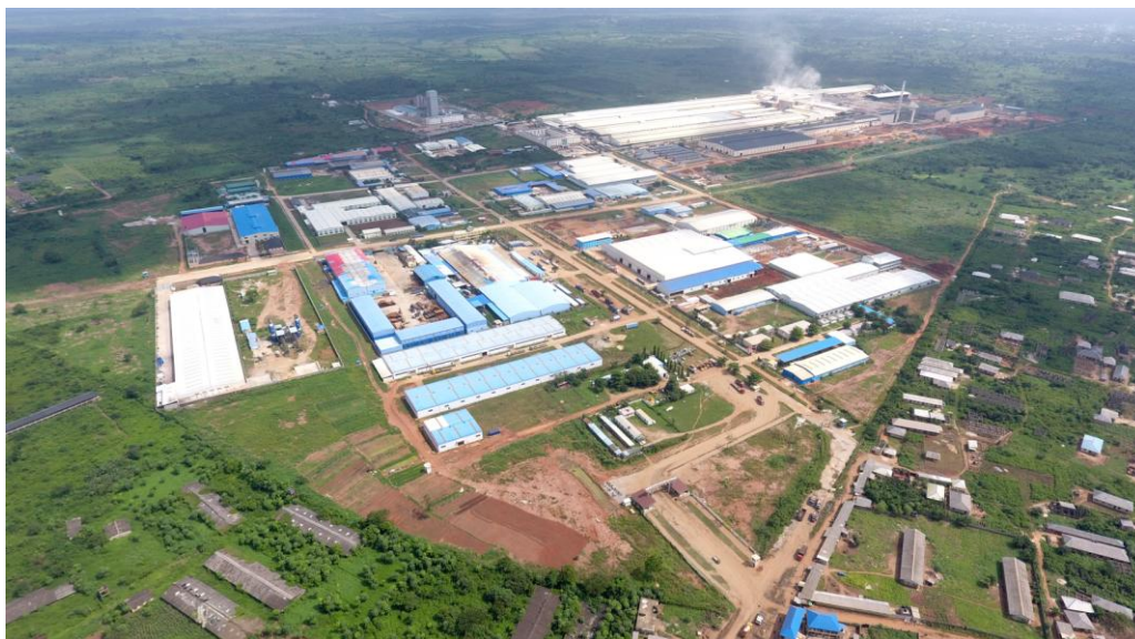
奥贡自贸区航拍图

1992年开始，尼日利亚在十字河流域州着手建设了第一个自贸区，即卡拉巴尔自贸区。经过二十多年的发展，目前，尼日利亚已有44个经贸合作区（包括工业城、出口加工区、自由贸易区、保税区、物流园区、科技园、旅游度假中心等各种形式的园区），分布在25个不同的州或联邦首都地区。其中，25个园区已经运营（包括奥贡广东自贸区和莱基自贸区），另有12个在建园区。据尼日利亚出口加工区管理局统计数据，已入园企业总共584家，吸引外资直接投资规模超300亿美元，本地投资规模超6200亿奈拉。尼日利亚联邦政府和州政府广泛参与各园区建设经营，以土地或资金等形式入股。尼日利亚现有园区根据地域特点，侧重不同投资重点，主要涉及制造业、仓储物流、食品加工、油气化工、地产开发、休闲购物等行业。