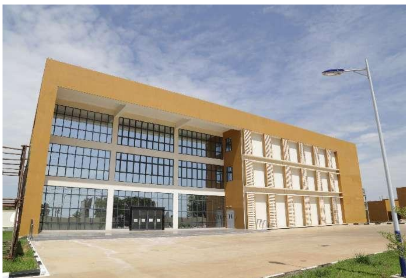
南苏丹空中交通管理系统工程项目