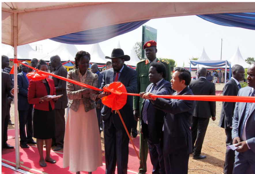
华为公司南苏丹国家宽带项目开工仪式

目前，南苏丹主要网络站点部署基本都在首都Juba（朱巴）区域，首都外城市Wau、Malakal、Torit、Renk和Rumbec也有少量站点。