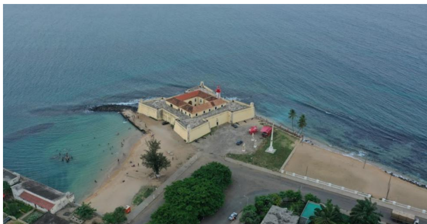
位于圣普首都圣多美的国家博物馆