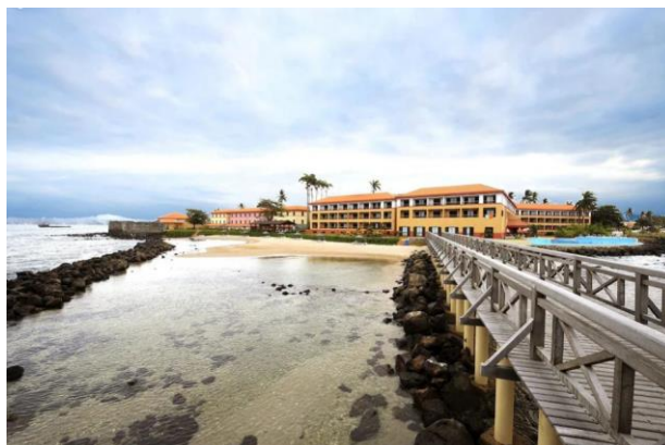
位于首都圣多美的佩斯塔纳酒店