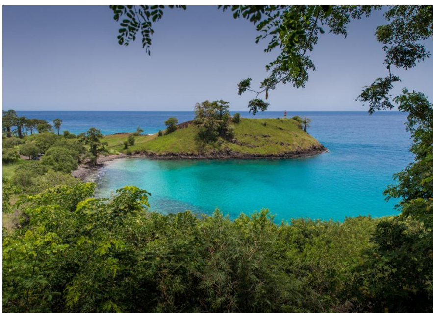
位于圣普首都圣多美的蓝湖景区