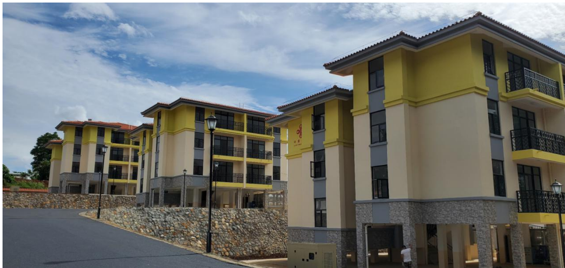
中国援圣普社会住房项目