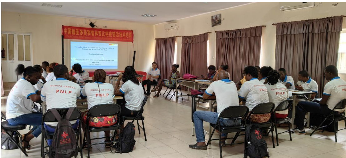
中国援圣普抗疟组为当地团队进行疟疾防控培训