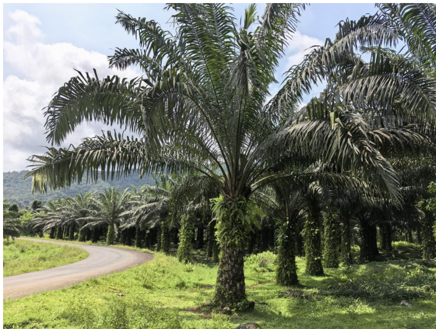
位于圣普南部的棕榈园