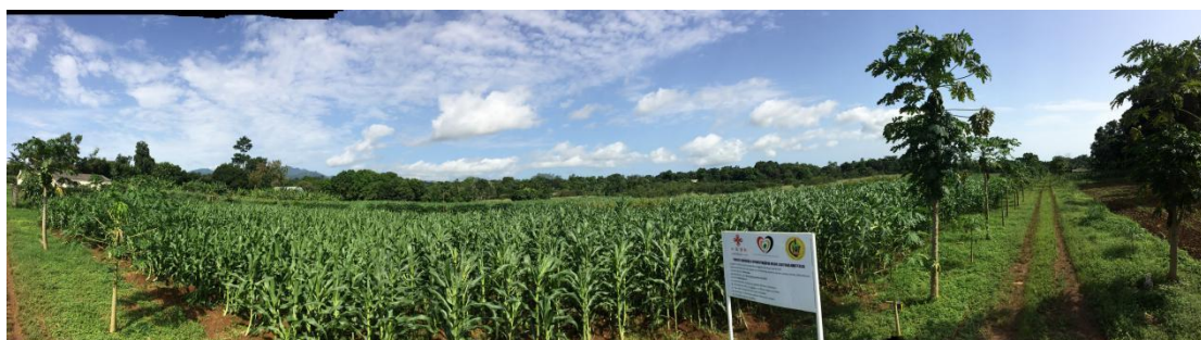
中国援圣普农技组在当地开展的玉米示范种植基地