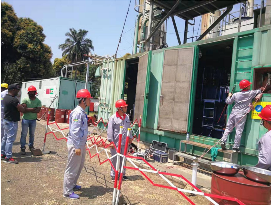
中国援圣普电力组开展设备维修