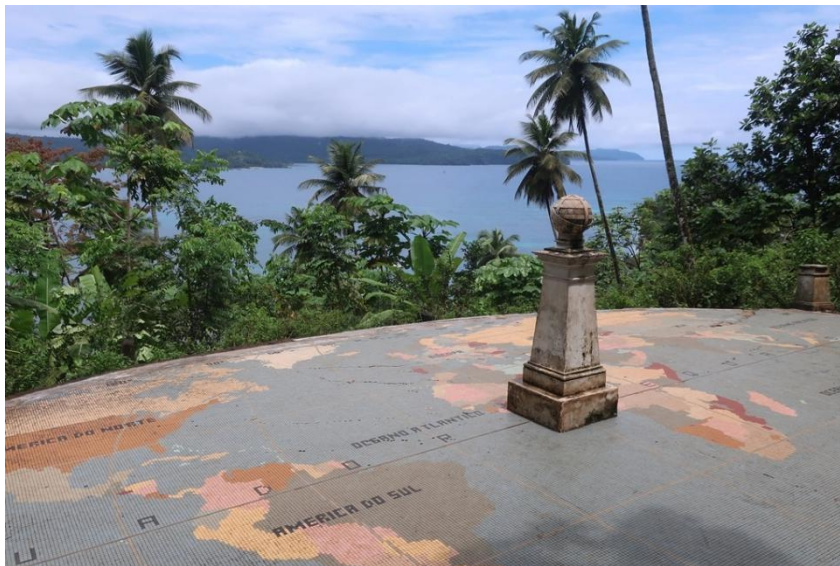
圣普“世界原点”地标

几内亚湾。圣多美岛距离非洲西岸255公里，面积为854平方公里；普林西比岛距离非洲西岸220公里，面积为136平方公里。两岛相距146公里。该国领土还包括其他邻近的附属岛屿Pedras Tinhosas、Bon éde Jóquei、Cabras Isles，以及赤道横越的斑鸠岛等。