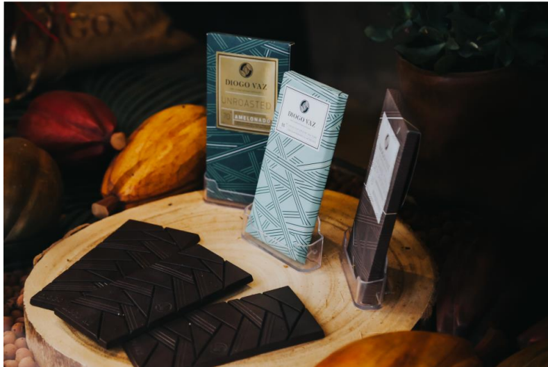
圣普巧克力曾荣获世界级大奖