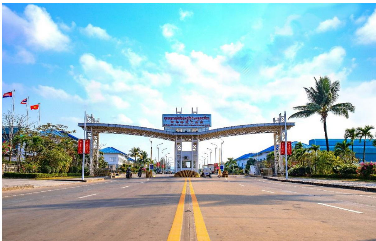
柬埔寨西哈努克港经济特区工业厂区

其他经济特区目前正在积极招商引资，扩大规模。浙江国际经济特区主要引入进出口企业，博格经济特区主要引进宠物用品相关企业，桑莎经济特区主要引入面辅料、服装加工企业，齐鲁经济特区引进了投资金额3.5亿美元的赛轮集团轮胎厂，斯努经济特区于2023年6月引入协议投资额1.38亿美元的双星柬埔寨轮胎工厂项目。