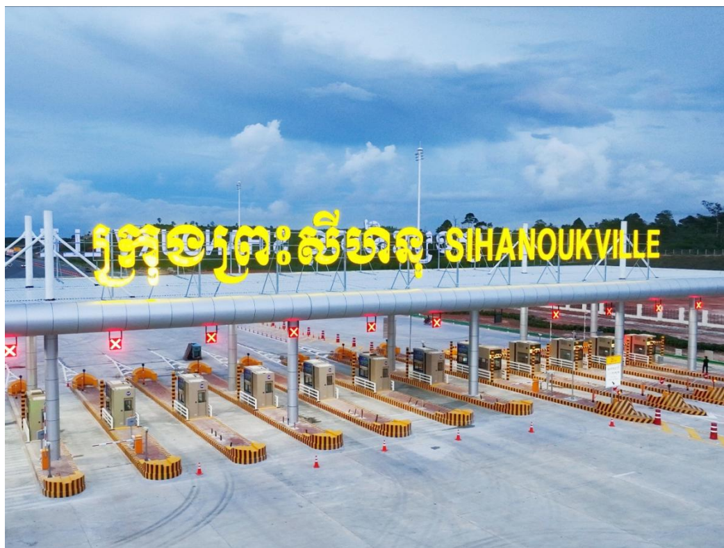
金边—西哈努克港高速公路收费站

2022年11月，柬埔寨首条高速公路金边—西哈努克港高速公路（简称金港高速公路）正式通车，标志着柬埔寨正式进入“高速时代”。该条高速连接柬埔寨首都金边和最大深水海港西哈努克港，全长187.05公里，采用中国设计及质量标准，由中国路桥工程有限责任公司采用BOT方式投资建设，于2019年3月开工建设，2022年11月9日，时任中国国务院总理李克强与时任柬埔寨首相洪森共同出席通车仪式。