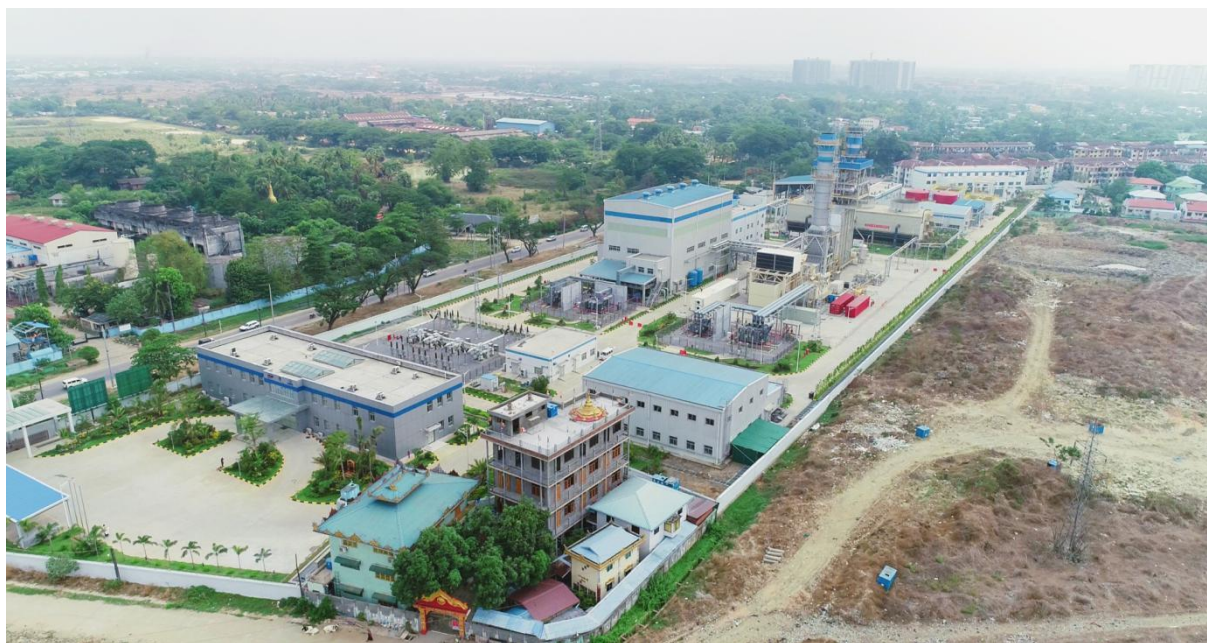
仰光达吉达天然气联合循环电站

目前，中资企业在缅投资主要集中在电力能源、矿业资源及纺织制衣等加工制造业等领域，投资项目主要采用BOT、PPP或产品分成合同（PSC）的方式运营。主要项目包括中缅油气管道、达贡山镍矿、蒙育瓦铜矿、瑞丽江一级水电站、太平江一级水电站、小其培水电站、迪吉燃煤电站、仰光达吉达燃气电站、皎漂燃气电站、阿隆燃气电站、海螺水泥、曼德勒光伏电站等。