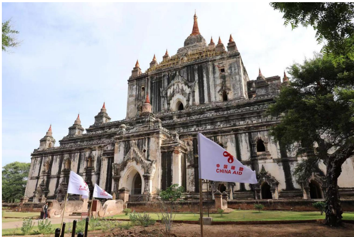
中方援助支持修复的蒲甘他冰瑜佛塔

85%以上的缅甸人信仰佛教，且十分虔诚，每天早晚均要念经一次，每逢农历初一、十五或斋戒日都要到寺庙朝拜，布施钱财、物品。遇有红白喜事或过生日等，也常请僧侣到家供斋或到寺庙布施。佛教传入缅甸已有上千年历史，宗教思想已深入到社会生活的各个角落，扎根缅甸人民的思想体系。另外，缅甸约8%的人信奉伊斯兰教。