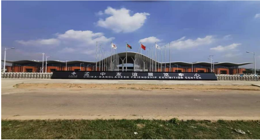
已经建成的孟中友谊展览中心