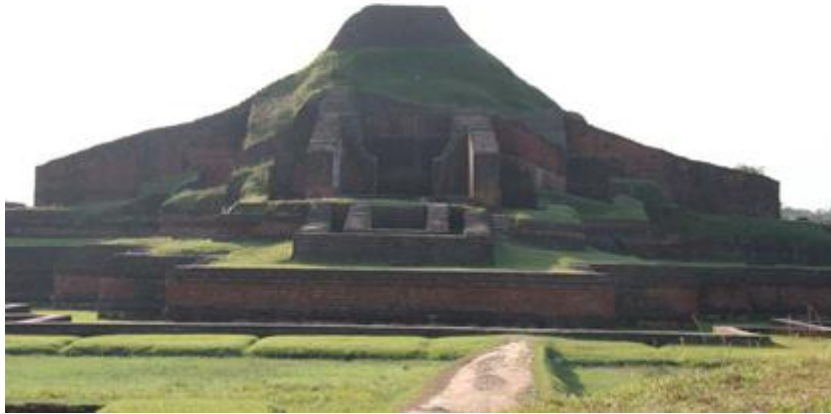
帕哈尔普尔佛教寺院遗迹