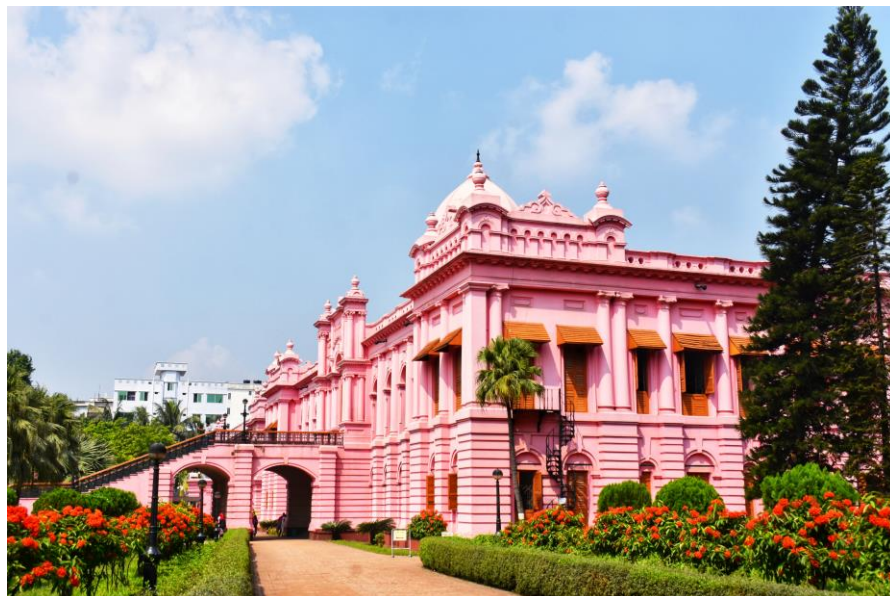
粉红宫殿（Ahsan Manzil Museum）