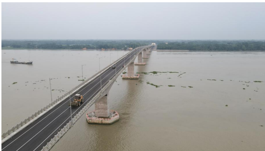
已经建成的友谊八桥项目

孟加拉国是中国对外承包工程重点市场之一。自“一带一路”倡议实施，特别是习近平主席2016年访问孟加拉国以来，中资企业在孟加拉国工程承包呈现多点开花趋势，主要集中在公路桥梁、铁路、港口水工、市政水务、电力能源、新能源、ICT等行业。企业正在积极尝试向投建营一体化方向发展。据中国商务部统计，2024年中国企业在孟加拉国承包工程新签合同额21.05亿美元，完成营业额37.98亿美元。累计派出各类劳务人员1299人。期末在外各类劳务人员数量4542人。